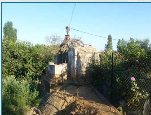
Noria de la Huerta del Pesebre (La Puebla de Los Infantes, Sevilla)