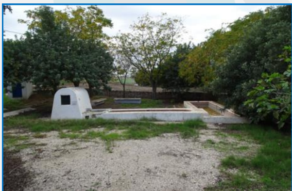
Fuente Larga (La Carlota, Córdoba) J. F. Martín Álvarez (noviembre, 2024)

En la provincia de Córdoba se han inventariado numerosas fuentes entre las que destacamos la fuente del cercado de las Pitás, la fuente del Rosal, alcubilla del Rosal de Trespacios, la fuente de la Rana, la fuente de la Virgencita, la fuente de Villa Alicia, la fuente de las Potrerizas de Ribera Alta y la fuente Alcolea en el municipio de Córdoba, la fuente de la Sacristana en Montoro, Fuente Larga en La Carlota, lavadero del Charco del Pilar en Villaviciosa de Córdoba, y la fuente de Mingobaez.