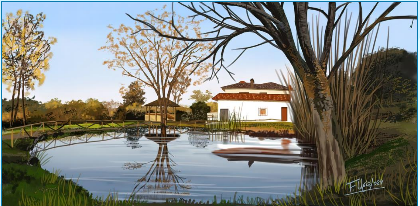
Laguna estacional del Jardín Botánico El Robledo (Constantina, Sevilla) Autor: F. Ugía Flores (julio, 2024). Imagen remitida por Antígona Márquez Pascual