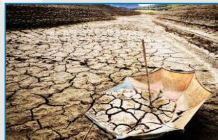
Efecto de la sequía en un embalse español

Las aguas subterráneas son, por tanto, un almacenamiento de indudable valor estratégico, que hemos de cuidar al máximo, proyectando todas las actuaciones sobre ellas con rigurosos conocimientos científicos, y con los necesarios condicionamientos técnicos para su mejor gestión".