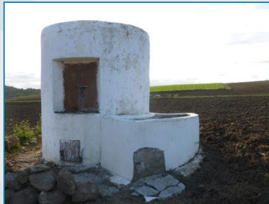
Pozos embovedados en La Dehesilla (La Puebla de los Infantes, Sevilla).