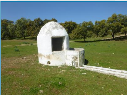
Pozo de la Florida en La Puebla de los Infantes (Sevilla).