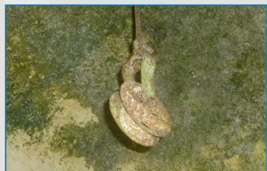
Detalle de una bóveda y de una carrucha.