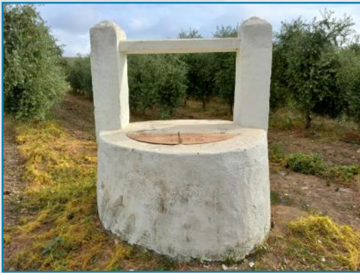
Pozo a cielo abierto en La Puebla de los Infantes (Sevilla).

Concluyendo diríamos que junto a las razones esgrimidas más arriba sobre el origen de los pozos característicos de La Puebla de los Infantes, de los embovedados en particular y también algunos de los de a cielo abierto, con dos pilares sobre el brocal que sostienen un travesaño de madera y este, a su vez, la carrucha que ayuda a elevar el cubo de agua, tienen una influencia mudéjar o morisca. Sabemos de la importancia de las técnicas hidráulicas de la cultura hispanomusulmana, en parte heredadas de la romana y esta a su vez de la cultura siria de 1.000 años a. C. Es obvio comprender que la bóveda con su portezuela tenía la misión de preservar el agua de la contaminación para ser ingerida por personas y animales, y le procuraba incluso más fresca en verano. Dichos pozos, la mayoría de ellos cuidados y encalados 4 , dejan como resultado en los campos de La Puebla de los Infantes unos paisajes de aguas muy peculiares y atractivos.