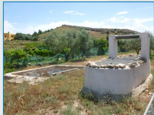
Pozo a cielo abierto de Níjar (Almería).