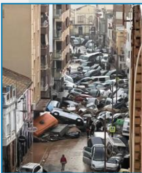
Efecto de la Dana del 29 de octubre de 2024 en una calle de Alfáfar (Valencia)

Cuando se presentan estas que pudiéramos decir "plagas hídricas", los políticos encuentran buena ocasión para sus proclamas y promesas, que ocupan primeros espacios en los medios de comunicación. Luego, como los hechos tardan más en ser realidades, y esas plagas hídricas no son excesivamente prolongadas, los proyectos técnicos se guardan en el baúl de los recuerdos... Vendrán después otros políticos, de otro color, que darán por malo lo que los anteriores prometieron, para hacer propuestas nuevas, divergentes, proyectadas muchas veces por los mismos técnicos, para "solucionar" los mismos problemas (quien paga manda), hasta que un nuevo ciclo... político inicie el mismo proceso, ante otro nuevo ciclo... hidrológico. Estos encuentros y desencuentros son la eterna canción, que se repite una y otra vez.