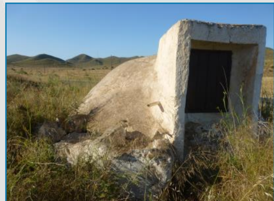
Pozo embovedado en Níjar (Almería).