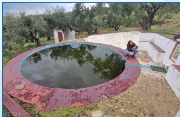
Fuente de los Terreros (Guadalcanal, Sevilla) A. Ventas (noviembre, 2024)

En la provincia de Huelva se catalogaron los pozos artesianos de Manuel Martín, Cerquilla y del Bajo la Cuartelá, el manantial del Bajo la Cuartelá en Isla Cristina, la fuente de los Caños en Hinojos, la fuente del Zumajo en Almonte, la fuente del Tojal del Palomo en Villarrasa, la fuente Árabe en Moguer, el pilar de Santa María en Arache, la fuente de los Santos en Cortegana y el nacimiento del barranco del Venero en Almonaster la Real.